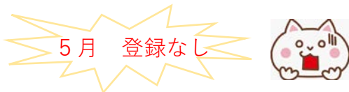
COPD-HF症例登録状況 (2022年5月30日現在)