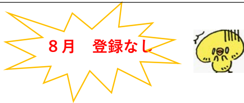
COPD-HF症例登録状況 (2022年8月31日現在)